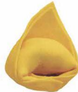
TT - Tortellone 26 gr