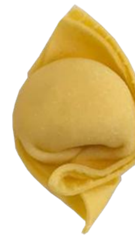
CP - Cappelletto 10 gr