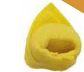
TB - Tortellino 2 gr