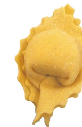
CP - Cappelletto 10 gr Frastagliato