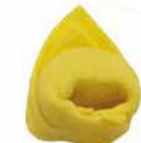
TC - Tortellino 4 gr